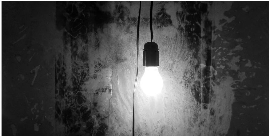
© FRANCISCO SANFUENTES, detalle de instalación en subterráneo del Museo, 2017

PALABRAS CLAVE: INSTALACIÓN · OSCURIDAD · CORROSIÓN