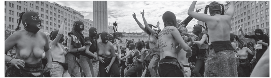
© PABLO IZQUIERDO, Marcha , 2018

PALABRAS CLAVE: FOTOGRAFÍA · AUDIOVISUAL · ARTE OBJETUAL · GRÁFICA