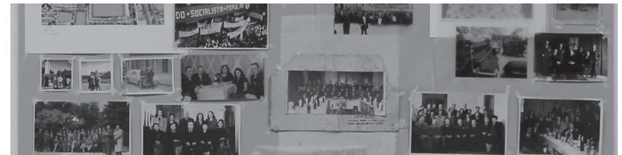
© CONSTANZA URRUTIA, Diagrama de obra , 2018

PALABRAS CLAVE: PROCESOS · OBRA · MONTAJE