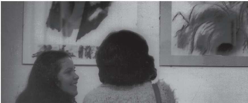
© JENIA JOFRÉ ca. 1978. Archivo Fech

PALABRAS CLAVE: COMUNIDAD · UNIVERSIDAD · RESISTENCIA · ARCHIVO · MEMORIA