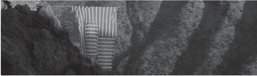
© SEBASTIÁN BAUDRAND, Sin título (de la serie Polímeros traslúcidos ), 2018

PALABRAS CLAVE: SITE-SPECIFIC · ESPACIOS · TERRITORIO