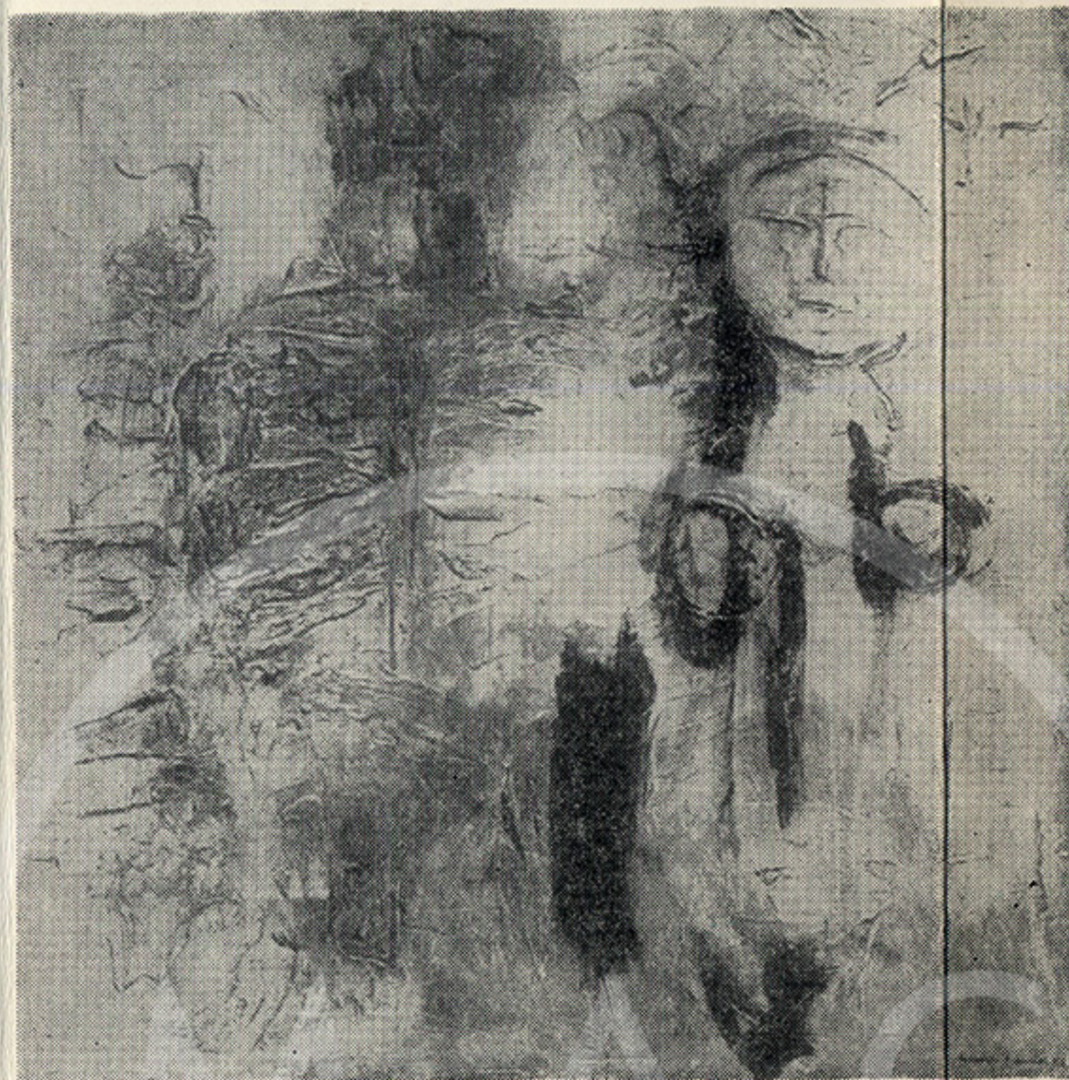
gracia barrios "hombres y mujeres"

pinturas mixtas sobre madera 116 x 121 cms. 1965