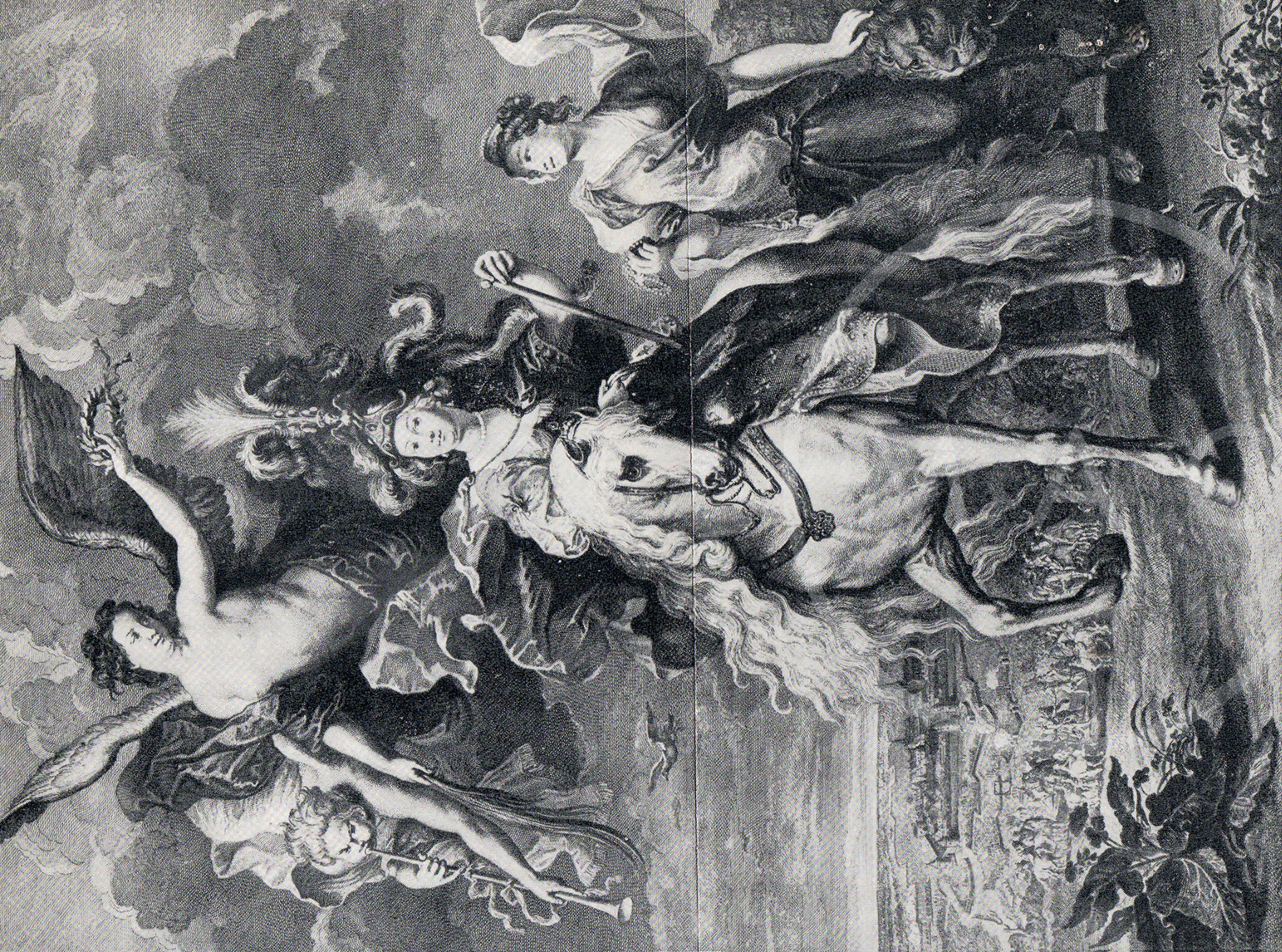
Le voyage de la Reine au Pont de Cè.

La Reine à cheval le casque en tête comme une autre Bellone va prévenir une guerre civile qui se préparoit par les tumultes de Cè. Cette Princeesse est accompagnée de la Victoire, et de la Renommée qui sont en lair; et de la Foire qui la suit à pied avec son panier. Le fond du Tableau est la ville du Pont de Cè, et au dessus de la ville, on voit un aigle qui poursuit des oiseaux de rapine; Allégorie à laquelle l'attention qu'on voit la Reine à dissiper les ennemis de l'Etat, le Duché de Luxembourg, au dessus de la ville des Mathurins. Avec Privilege du Roy.