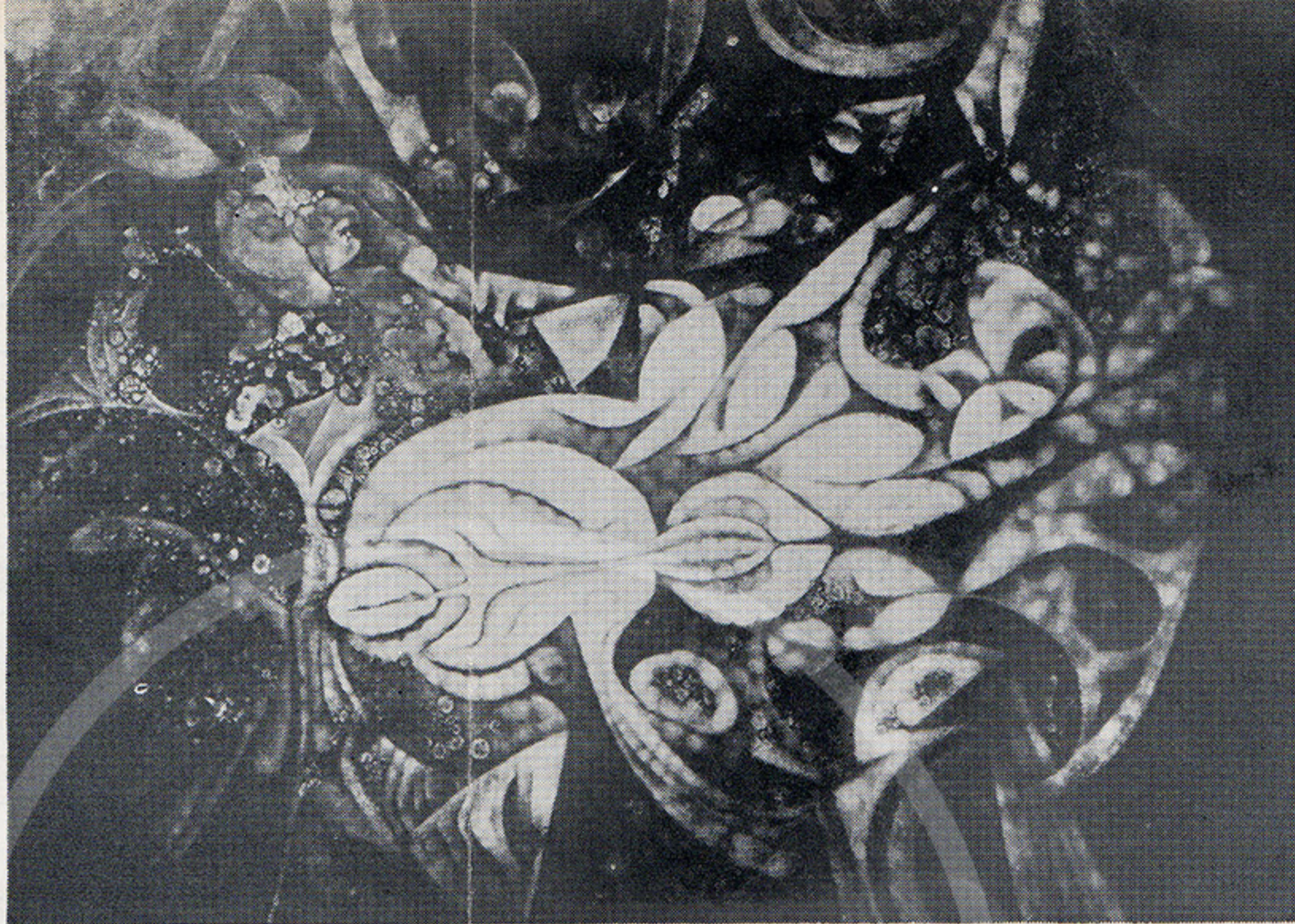
20 FEDERICO ASSLER "Acontecimiento Intimo" Oleo, 1966 180 x 130 cms.

La pintura reciente de Federico Assler se distingue por su grave opulencia. La severidad de sus grises se enlaza con la pródiga riqueza de sus colores reverberantes como piedras entrevistadas en el fondo del agua. Con mirada de felino cazador de misterios, Federico nos introduce en su mundo mágico con la fantasía más espontánea, jugando como Alicia en el País de las Maravillas, descubridor de tesoros, descifrador de enigmas. Entre los jóvenes, Assler es inconfundible, tenaz y milagroso al mismo tiempo. Las disciplinas más estrictas a que se somete, no le impiden ser tan libre como un vagabundo que sueña despierto por los caminos, las selvas y las honduras de la tierra.